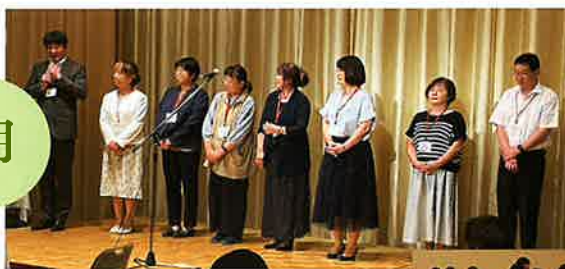
「楽しく、こんな活動しています！」

手稲区西区PTA連絡会 ホテルヤマチin琴似 稲雲・手稲・あすかぜ・西陵 4校で意見交換