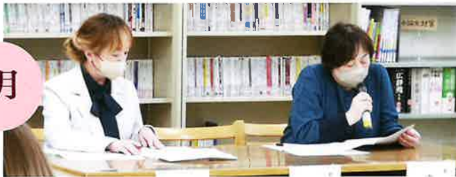
「新しい保護者との出会い。楽しくやりましょうね！」