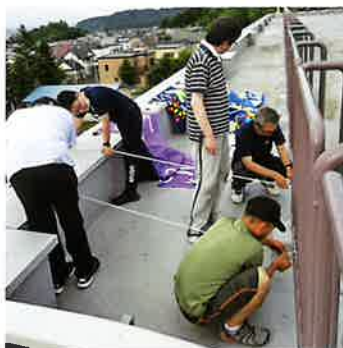
危険が伴う垂れ幕設置