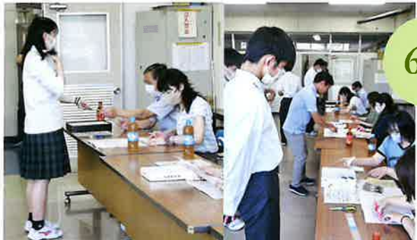
「勉強頑張っってね！」