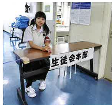
学校祭を動かす本陣